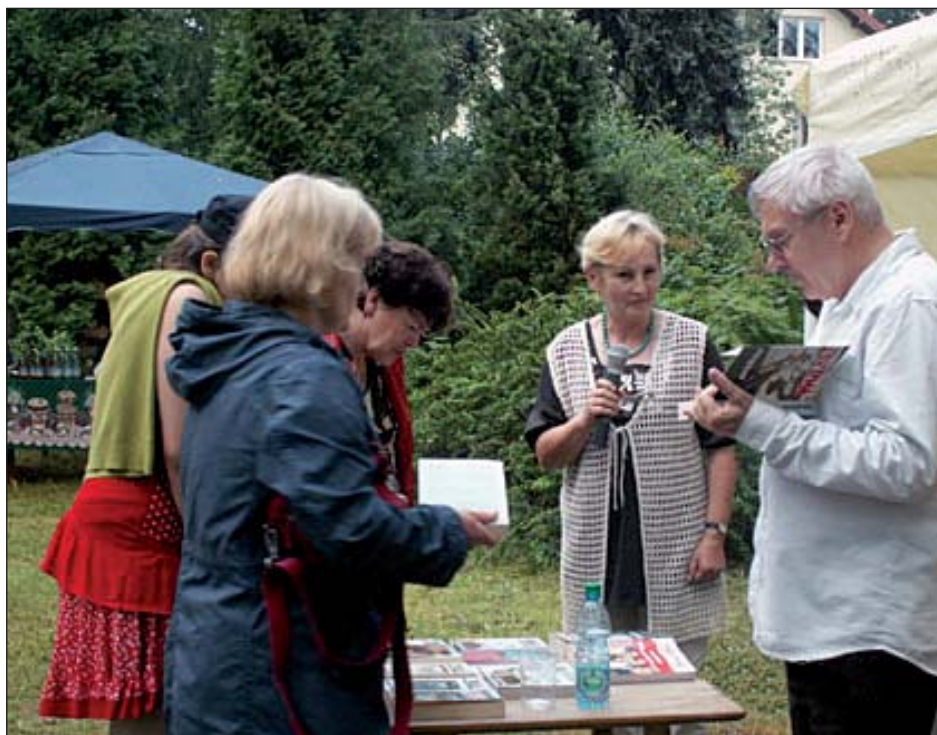
Po spotkaniu był czas na luźne rozmowy.

mysł zrodził się kilka lat temu, kiedy obchodzona była... rocznica istnienia biblioteki w Komorowie. Pomysłodawcy obecnie zbierają pieniądze na ten cel. Można nabywać cegiełki w wysokości 10 zł, 20 zł, 50 zł, 100 i 200 zł. Zachęcamy wszystkich mieszkańców Komorowa, aby włączyli się w tę inicjatywę. To naprawdę dobry pomysł, aby wzorem Krakowa czy Krynicy, stanęła w Komorowie ławeczka, a obok niej postać Marii Dąbrowskiej, którą Komorów często jest łączony.