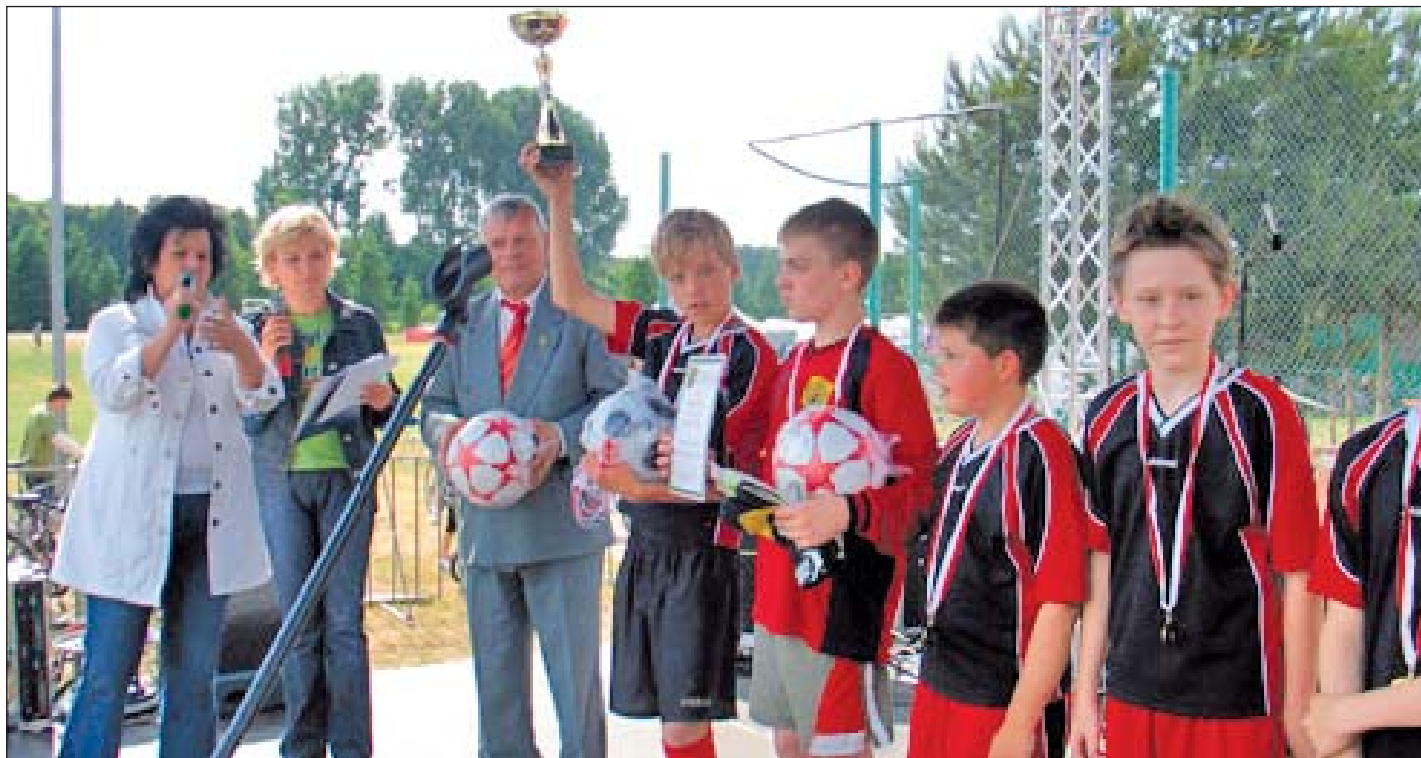
Wszyscy sportowcy zostali nagrodzeni at 14.06.2008

Równoległe z występami scenicznymi, na terenie szkoły odbywało się szereg imprez towarzyszących, z czego znaczącą część stanowiły liczne konkurencje sportowe. Były biegi przełajowe,