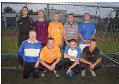
Turniej wygrała drużyna „Albi Celeste”.

Kiedy w sobotę 19 lipca w Michałowicach Wsi kończyły się Mistrzostwa Świata Modeli Ślizgów klasy M, na Osiedlu Michałowice rozpoczął się dwudniowy turniej piłki nożnej.