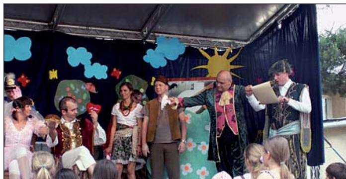
Rodzice przedstawili „Kota w butach”.