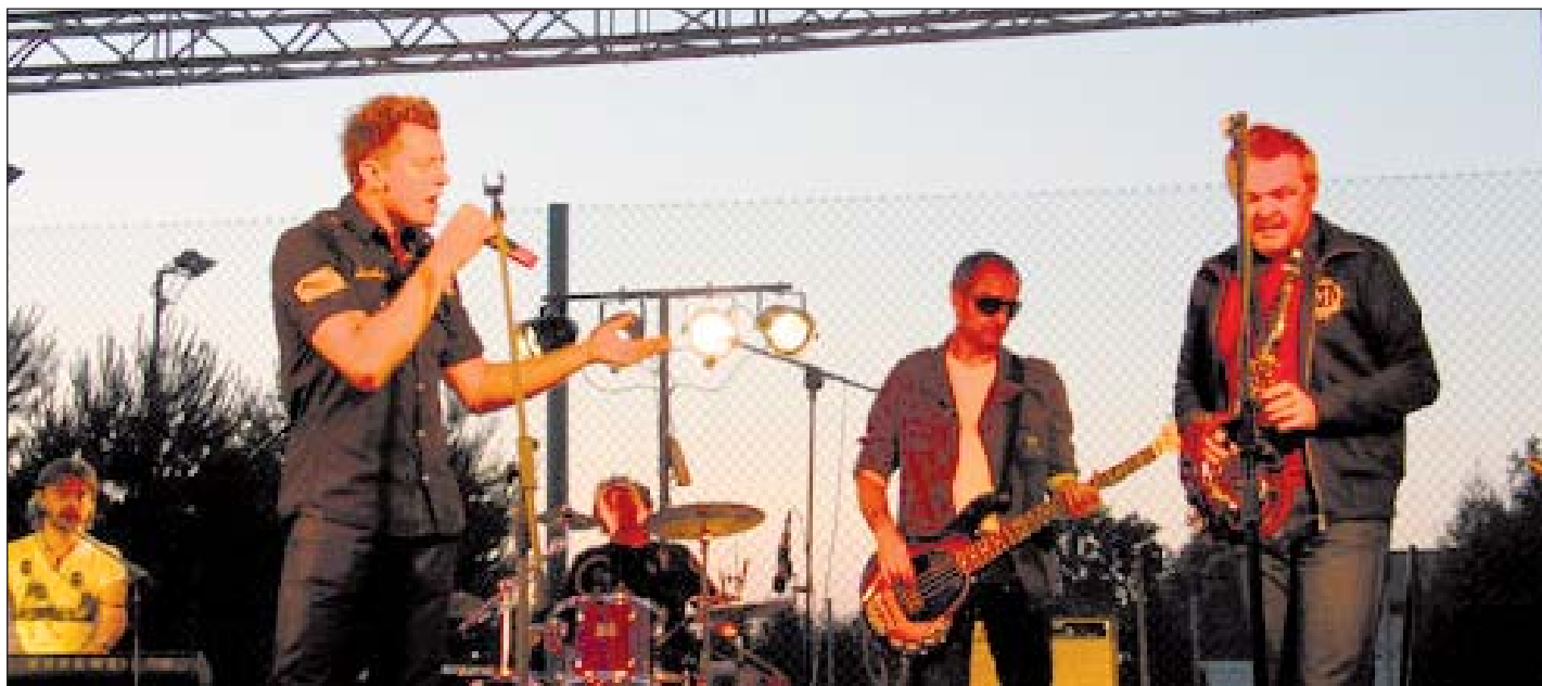
Zespół De Mono na wieczornym koncercie at 14.06.2008

rozegrano turnieje tenisa stołowego i mecze piłki nożnej.