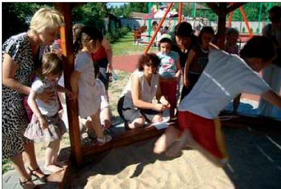
Skok do piaskownicy, najlepszy wynik 216 cm

Najgłośniejszą jednak kibicowano w czasie biegu z przeszkodami. Przeszkodami były dwie ślizgawki, na które najpierw trzeba było się wspiąć, a następnie jak najszybciej zjechać. Najlepszy czas to 15,25 sek – z pewnością wystarczyłyby na minimum olimpijskie.