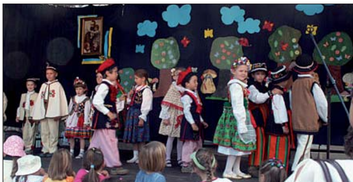
Dzieci występowały w strojach ludowych.