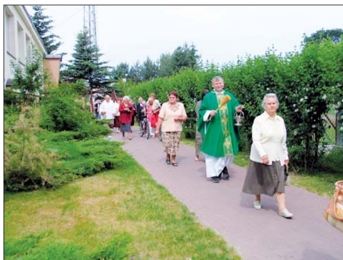
Po Mszy Świętej udano się na pobliski parking, gdzie poświęcone zostały pojazdy at 15.06.2008 at 20.06.2008