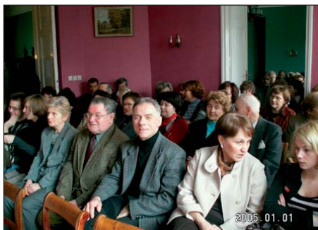
Zastuchani w poezji