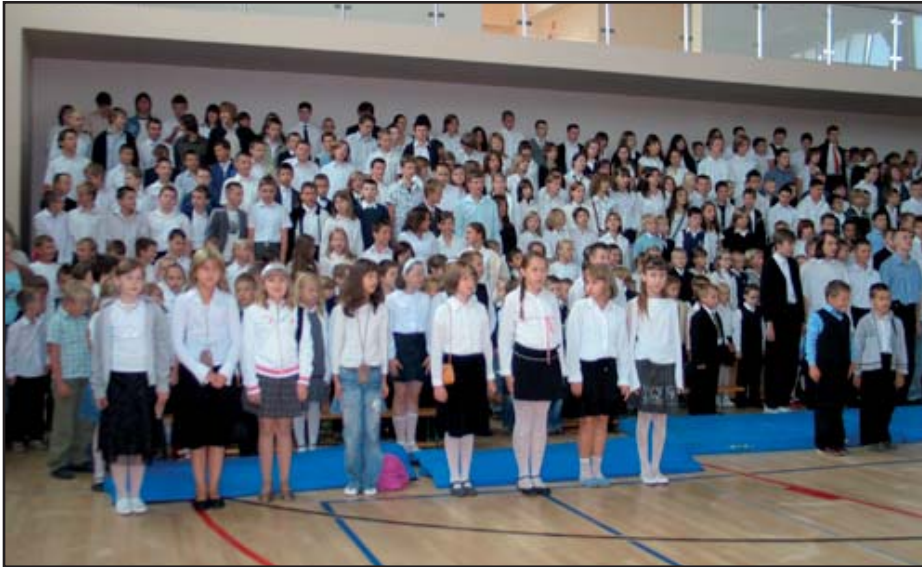
Uczniowie z Nowej Wsi.

W sferze społecznych celów Gminy Michałowice poczesne miejsce zajmuje oświata, która stanowi wspólne dobro całego społeczeństwa. System oświaty zapewnia w szczególności realizację prawa dzieci i młodzieży do kształcenia, wychowania i opieki, odpowiednich do wieku i osiągniętego rozwoju.