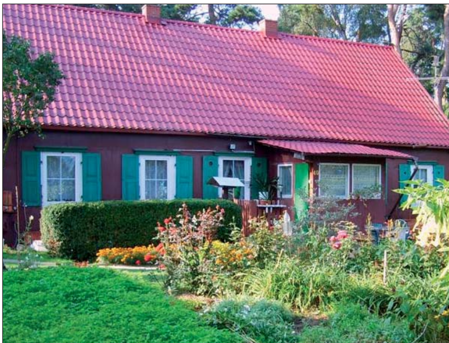
Pierwszy dom w Komorowie- koniec XIX w.

W dniu 2 sierpnia 1944 r. w okolicy numeru 36 Al. M. Dąbrowskiej rozegrała się regularna nierówna bitwa między powstańcami leżącymi w brzdach kartofli a Niemcami okopanymi w lasku. Ostatecznie po 2 godzinach walki powstańcy poddali się, zostali przetransportowani do Pęcic i tam rozstrzelani. Miejsce to dziś upamiętnia wspaniały pomnik w Pęcicach a co roku odbywają się tam uroczystości związane z Powstaniem Warszawskim.