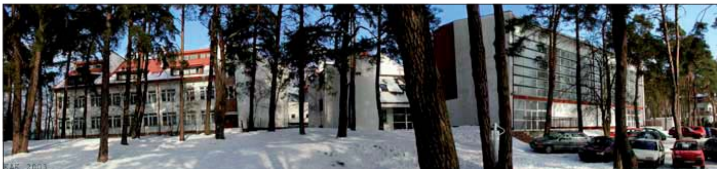
Zespół Szkół Ogólnokształcących w Komorowie

Uzyskanie kolejnego wyższego stopnia awansu zawodowego związane jest z odbyciem określonego przepisu stażu i uzyskaniem akceptacji komisji kwalifikacyjnej lub egzaminacyjnej. Ze stopniem awansu zawodowego powiązana jest bezpośrednio wysokość wynagrodzenia zasadniczego nauczycieli oraz stabilizacja zawodowa.