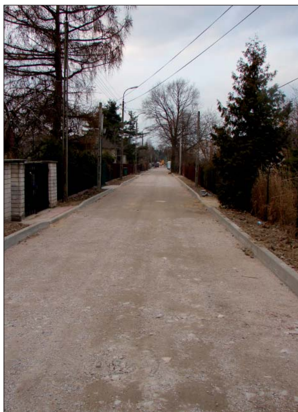
Budowa ul. Jodłowej w Granicy

potrzebne jest nam pozwolenie na budowę. A to trwa – projektowanie i uzgadnianie projektu. Mamy zamiar w porozumieniu z m.st. Warszawą, z dzielnicą Ursus rozpocząć prace projektowe dla ul. Bodycha, w pierwszej kolejności na odcinku od ul. Sosnkowskiego do ul. Jesionowej i w przyszłym roku ją zakończyć, w roku bieżącym na to zadanie przeznaczamy 200.000 zł . Podobne rozwiązanie dotyczy ul. Bodycha od Al. Jerozolimskich do ul. Ryżowej. Dla Opaczu Małej w porozumieniu ze Starostwem Powiatu Pruszkowskiego mamy zamiar wykonać dokumentację odwodnienia ul. Targowej. Dopiero po wykonaniu odwodnienia Starostwo zapowiedziało dokończenie remontu tej ulicy do granicy z Gminą Raszyn. Dla Wsi Michałowice, dla ul. Kasztanowej i ul. Ks. Józefa Poniatowskiego wykonywany jest już projekt drogi wraz z chodnikiem i odwodnieniem. W pierwszej kolejności należy wykonać kanał odwadniający wzdłuż ul. Kasztanowej i budowę winniśmy rozpocząć w końcu bieżącego roku. Koszt budowy tego kanału będzie bardzo wysoki ( 500.000 ). Wynika to z prostej przyczyny, że ten kanał ma służyć do odwodnienia kilkuset ha na terenach Wsi Michałowice i części terenów Opaczu Małej. Projektowany jest z wyprze-