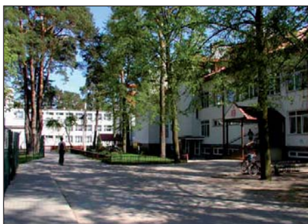
Zespół Szkół w Komorowie.

Dochodzimy wreszcie do dawnego pałacu zbudowanego w końcu XIX wieku na gruzach spalonego wcześniejszego drewnianego dworu. Obok pałacu znajduje się wspaniały park z rzadkimi gatunkami drzew i ze stawami, w których dawniej hodowano karpie. Obecnie zabytkowy park jest zupełnie zarosnięty chwastami i zaniedbany, co zupełnie nie wzrusza konserwatorów zabytków. Przy pałacu bestialsko przebudowanym w latach