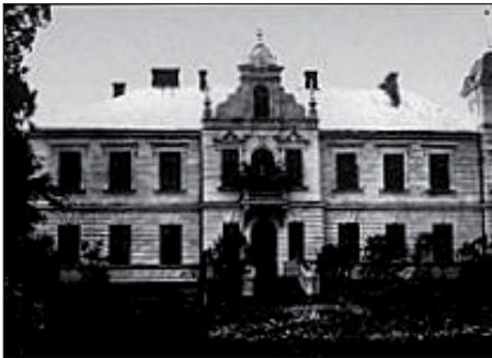
Dawny widok pałacu w Komorowie.