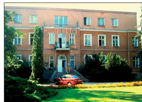
Pałac w majątku.