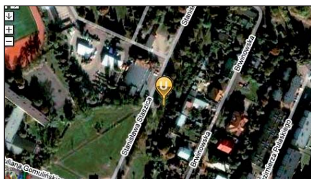
U.S. w Pruszkowie – widok z kosmosu

Zachęcamy wszystkich podatników, dla których właściwym organem podatkowym jest Naczelnik Urzędu Skarbowego w Pruszkowie do wcześniejszego składania zeznań