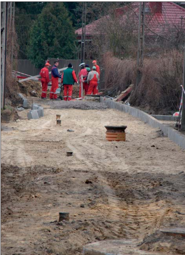
Budowa ul. Okrężnej w Komorowie

Dwa lata temu rozpoczęliśmy realizację programu budowy miejsc rekreacji, w szczególności rekreacji dla dzieci. Pierwszy ogródek jordanowski już powstał w Komorowie Wsi. To do niedawna zaniedbane miejsce zmieniło swój obraz, na obraz niemal bajko-