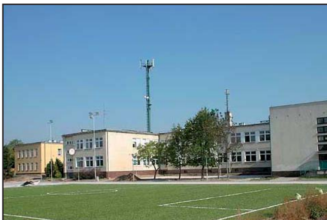
Zespół Szkół w Michałowicach