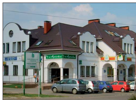
Obecne Centrum Handlowe.