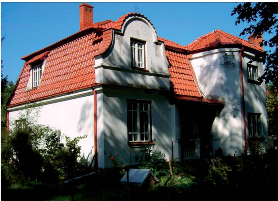
Willa inż. Zakrzewskiego.

Na przeciw ul. Zamojskiego na polach majątku w latach 50. zbudowano dwie spółdzielnie mieszkaniowe ciągnące się aż do majątku: „Trzcina” z elementów mazurskiej trzciny i „Domeczek” – domy z cegły.