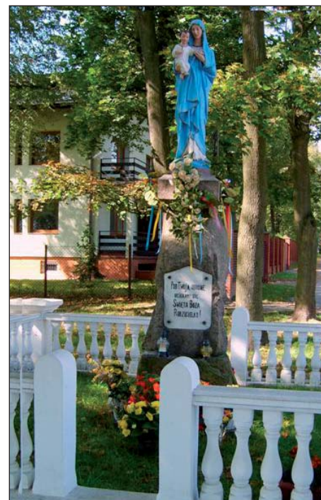
Figurka Matki Boskiej.