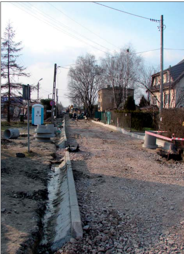
Budowa ul. Ogrodowej w Regulach

W zakresie budowy wodociągów inwestycje praktycznie zanikają, bo tak naprawdę we wszystkich starych ulicach w gminie wodociągi prawie już zbudowaliśmy. Dzięki zakończeniu budowy wodociągu w ul. Polnej w Michałowicach po kilkunastu latach oczekiwania zwodociągujemy ul. Mokrą, Jasną, Grabową i Żurawią ( 145.000 ). Po zakończeniu regulacji stanu prawnego dróg wodociąg dotrze na ul. Świerkową i ul. Żwirki i Wigury w Michałowicach ( 148.000 ). Wodociągu doczeka się końcówka ul. Regulskiej ( 51.000 ), także w Michałowicach. Po zakończeniu tych robót wodociągowych możemy powiedzieć – zakończyliśmy budowę wodociągów w Michałowicach. Jak informowaliśmy w naszym gminnym biuletynie przeprowadzona została ogromnym wysiłkiem finansowym Gminy modernizacja Stacji Uzdatniania Wody w Pęcicach. W roku bieżącym połączymy magistralą wodociągową na stałe system wodociągowy Pęcic oparty o tę stację z systemem wodociągowym Komorowa opartym o Stację Uzdatniania Wody w Komorowie Wsi ( 60.000 ). W razie potrzeby oba systemy będą mogły się nawzajem wspierać. Na terenie naszej Gminy w zamierzonych czasach też już były wodociągi „publiczne”. Jeden był w Zakładzie Doświadczalnym In-