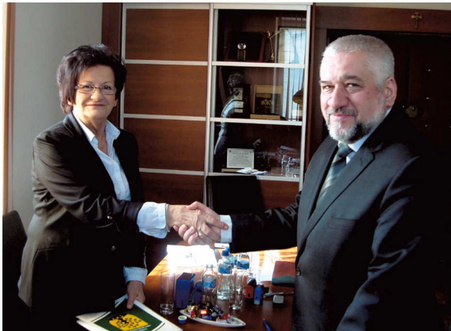
LUTY 2011 – podpisanie umowy

Od 1973 roku Urząd Gminy Michałowice ma swoją główną siedzibę w Michałowicach, przy ulicy Raszyńskiej, w budynku mieszkalnym, który był przy-