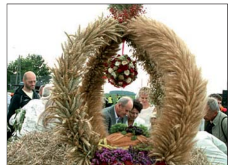
Prezentowane wieniec podczas Dożynek Gminnych