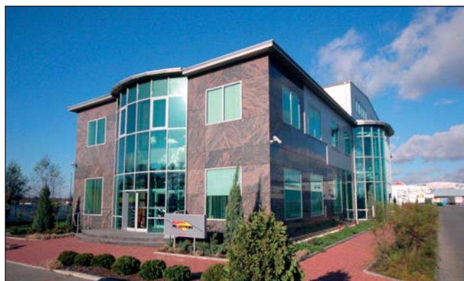
Siedziba firmy w Sokołowie