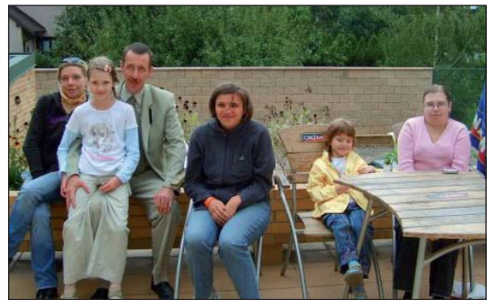
Za największą wartość szkoleń uczestnicy uznali dostosowanie programu do indywidualnych potrzeb