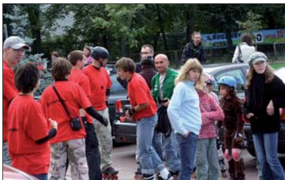
Podczas pikniku Stowarzyszenia K40

Zanim rozpoczął się piknik, miłośnicy wrotek, rolek i rowerów o godzinie 15.00 wystartowali z parkingu przy szkole w Komorowie. Ruszyła pierwsza rolkomasa czyli masowy przejazd rolkarzy, wrotkarzy, rowerzystów ulicami Komorowa. Przejazd miał wytyczone dwie trasy – mniejsza prowadziła przez Ostoję i zakończyła się pokazem