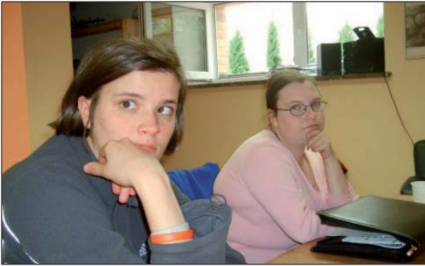
Zajęcia prowadzone były przez psychologa, pedagoga oraz doradcę zawodowego

W dniach 20-31 sierpnia, dzięki staraniom Gminnego Ośrodka Pomocy Społecznej w Michałowicach w ośrodku „Olimp” przy ul. Kościuszki 5 odbyły się warsztaty prowadzone przez Caritas AW w ramach projektu „Indywidualne ścieżki kariery zawodowej szansą dla osób niepełnosprawnych”.