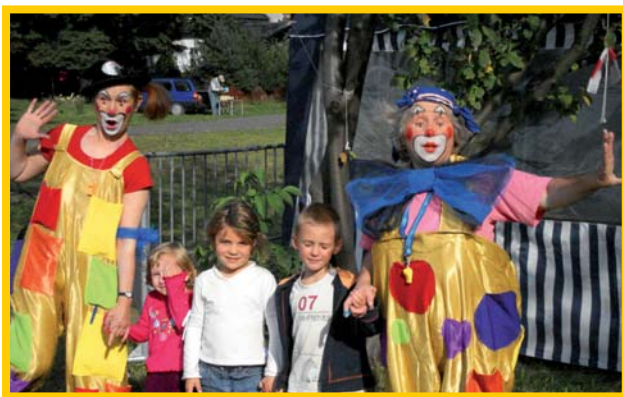
Festyn „Pożegnanie lata” odbył się w parku w Pęcicach