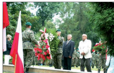
Składanie wieńców pod pomnikiem mauzoleum