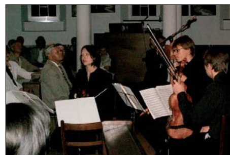
Występ kwartetu smyczkowego Synaxis. Komorowska Jesień Muzyczna 2006