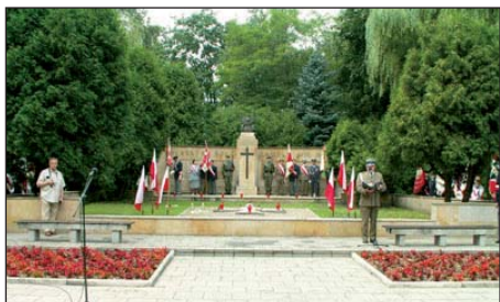
Podczas uroczystości upamiętniającej Powstanie Warszawskie

W Pęcicach w ostatnią niedzielę lipca odbywały się – jak każdego roku – uroczystości upamiętniające bitwy i egzekucje Powstania Warszawskiego.