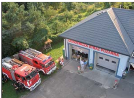
Jesienny Piknik Strażacki – widok z góry

W sobotę, już od samego rana przygotowywano sprzęt, rozkładano scenę i dmuchane zabawki dla najmłodszych. Pierwsi uczestnicy pojawili się już po godzinie 11 i od razu kierowali się do wspomnianej loterii fantowej. A naprawdę warto było!!! Każdy, kupiony za 5 złotych los, wygrał. Wśród nagród były maskotki, książki, obrazy, wazon, sadzonki roślin ogrodowych, a także grzejnik i aparat cyfrowy. Nie zabrakło także bar-