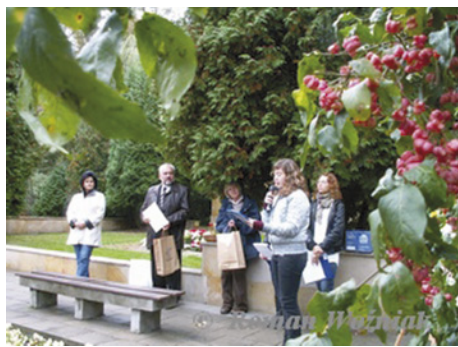
Wyróżnieni sami recytują swoje wiersze