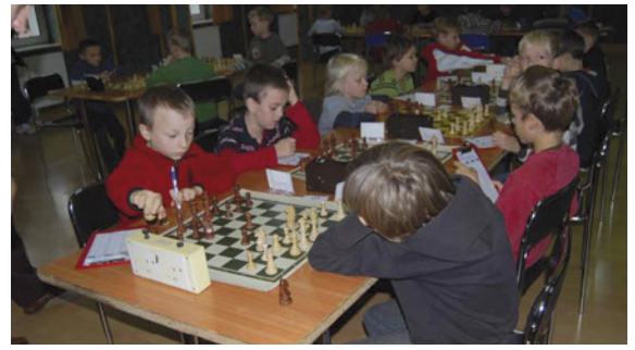
Walka na szachownicach naszych młodych reprezentantów