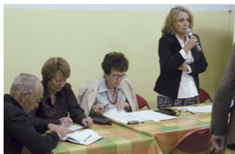
Członkowie Zarządu Osiedla Komorów podczas obrad zebrania