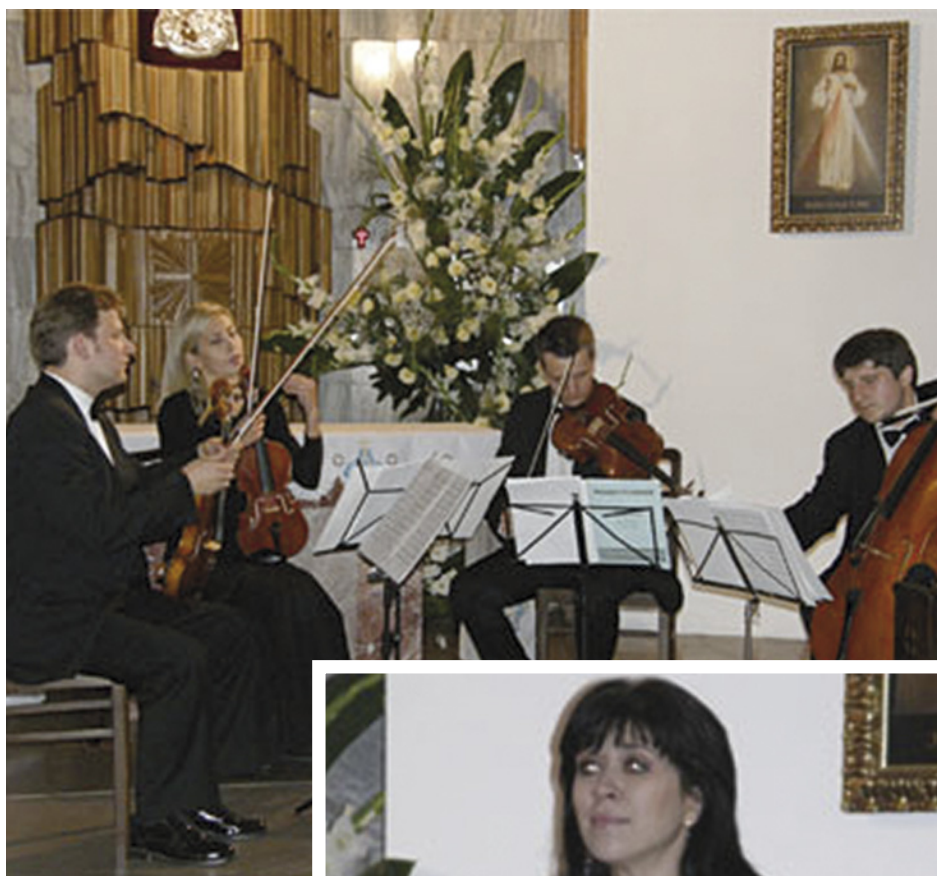
Występ kwartetu smytkowego Synaxis