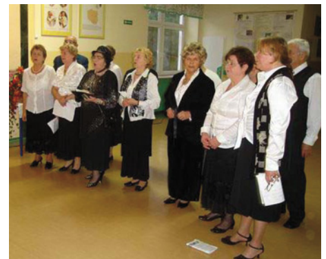
Występ chóru „Michałowiczanka”