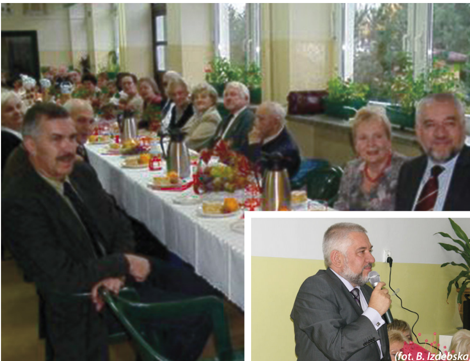
Spotkanie w Michałowicach