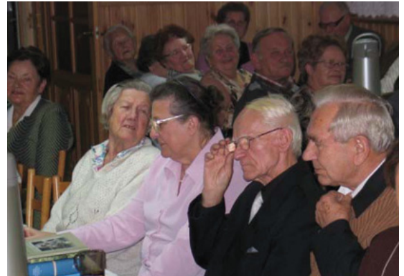
Seniorzy w Nowej Wsi