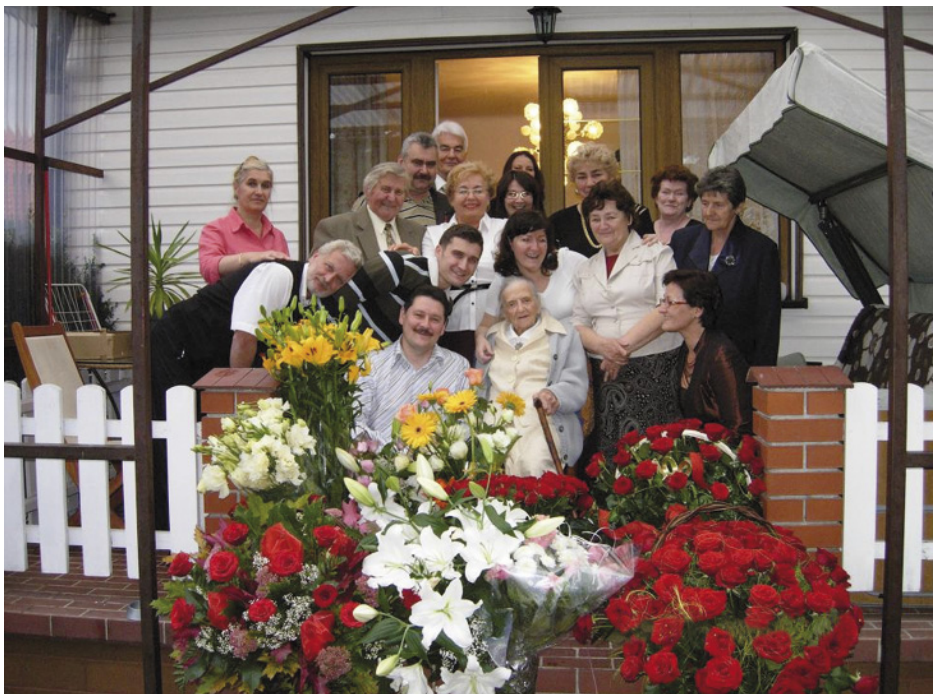
Jubilatka w otoczeniu rodziny.

w Michałowicach, wybudowała dom. Uczestniczyła w życiu społecznym, zajmowała się ogródkiem oraz prowadzeniem domu. Urodziła troje dzieci. Jubilatka doczekała się sześciorga wnuków, jedenaścioro prawnuków i jednej prapraprawnuczki.