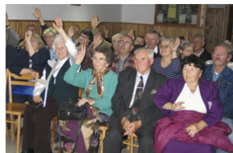
Mieszkańcy Nowej Wsi głoszący nad uchwałą o przeznaczeniu środków