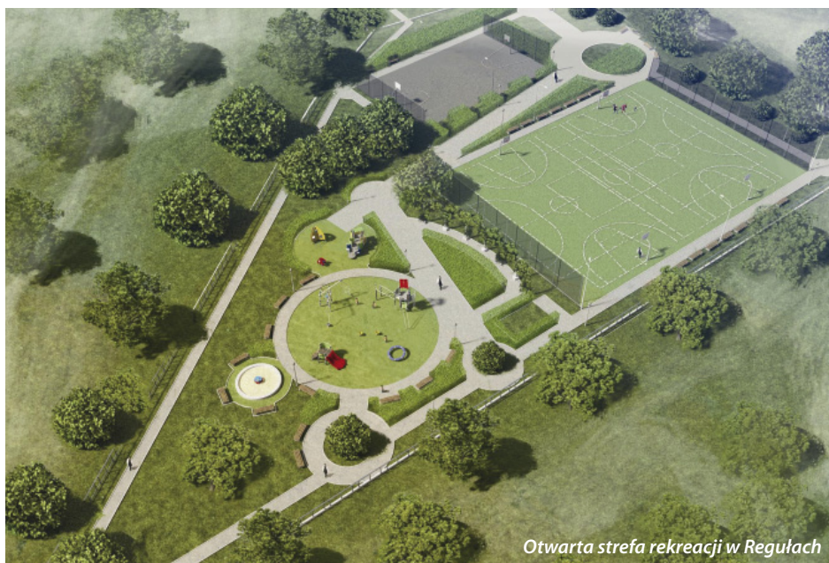
Otwarta strefa rekreacji w Regułach

Uwaga: ostateczne realizacje otwartych stref rekreacji mogą odbiegać nieznacznie od przedstawionych wizualizacji.