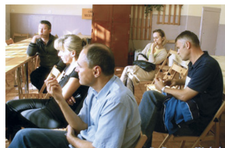
Mieszkańcy Pęcic Małych w trakcie zebrania