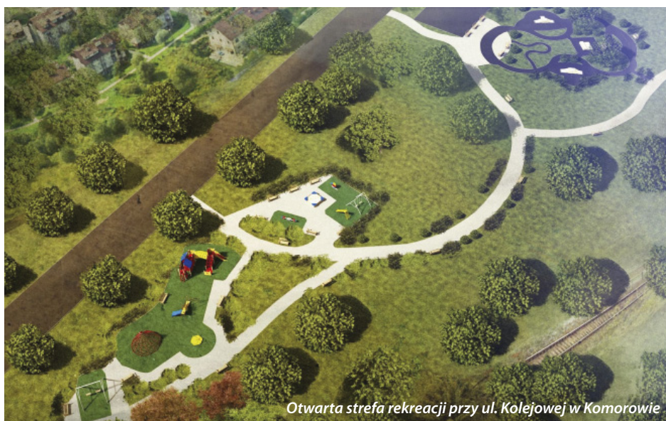
Otwarta strefa rekreacji przy ul. Kolejowej w Komorowie