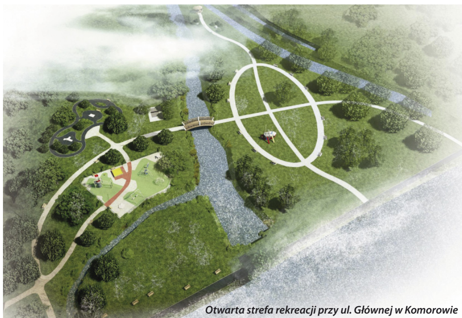
Otwarta strefa rekreacji przy ul. Głównej w Komorowie