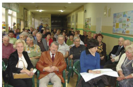
Mieszkańcy osiedla Michałowice

Mieszkańcy sołectwa Pęcice Małe na zebraniu w dniu 27 września podjęli uchwałę o przeznaczeniu środków z funduszu sołeckiego na rozbudowę. cd. na str. 6