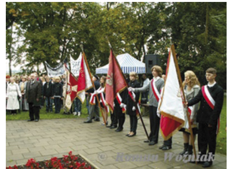
Początek sztafety sztandarowej

Jak co roku, odbył się konkurs upamiętniający historię Boju pod Pęciami „Ci, co zginęli w walce...” pod patronatem Wójta Gminy Michałowice. Brali w nim udział uczniowie trzech gminnych gimnazjów: z Komorowa, Michałowic i Nowej Wsi. Tradycyjnie, mogli przedstawić prace w dwóch kategoriach: literackiej i plastycznej. W tym roku popularnością cieszyła się pierwsza – powstało aż 29 prac konkursowych w formie