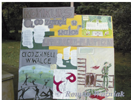
Wystawa najlepszych prac

Poniatowskiego, Zespołu Szkół Ogólnokształcących z Komorowa im. Marii Dąbrowskiej. Pierwszy raz uczestniczyła w rajdzie młodzież z Zespołu Szkół nr 26 im Bohaterów Powstania Warszawskiego 1944 roku. Po raz drugi przyszli uczniowie Zespołu Szkół Technicznych z Pruszkowa.