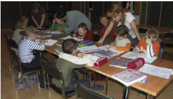
Sala gry zamieniona w salę lekcyjną, wspólne odrabianie lekcji

Od samego początku widać było fantastyczne zgranie całej ekipy młodych szachistów. Doskonałym przykładem był moment zajmowania pokoi. O ile samo wejście na drugie piętro dla nikogo nie stanowiło problemu, to jednak wniesienie tam bagaży przez drugoklasistów było już pewnym wyzwaniem – niektórzy z najmłodszych byli mniejsi od swoich bagaży. W tym momencie na pomoc ru-