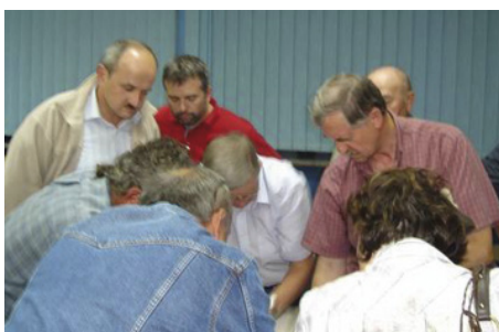
Mieszkańcy Michałowic Wsi oglądają mapę swojej miejscowości z zaznaczonym przebiegiem budowanej drogi ekspresowej