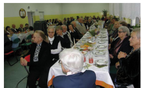
Święto Seniora w Komorowie