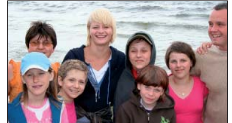
Wakacje nad morzem w Mikoszewie