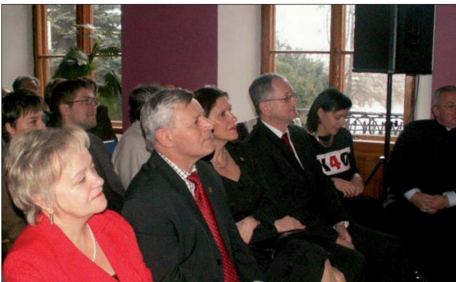
Podczas Krakowskiego Salonu Poezji w Komorowie.

W świątecznym numerze Biuletynu zostanie zamieszczona rozmowa z Anną Dymną.