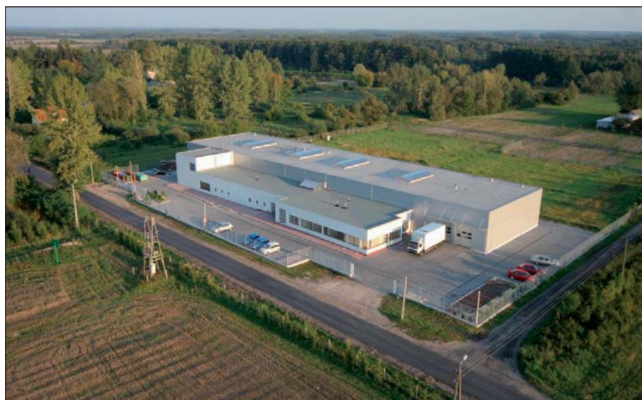
Siedziba firmy w Pawłowicach