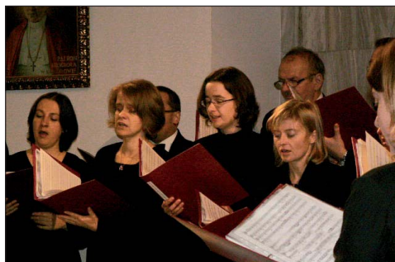
Występ chóru Collegium Musicum Uniwersytetu Warszawskiego