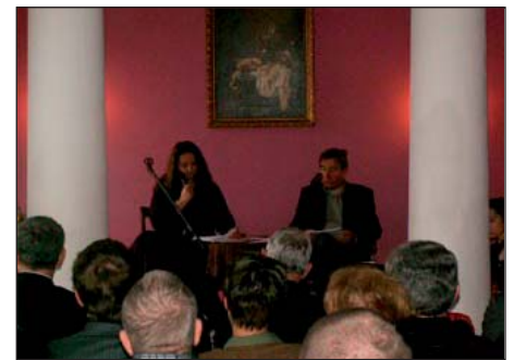
Anna Dymna i Jerzy Radziwiłowicz

Inicjatorem i gospodarzem Salonu w Komorowie jest Stowarzyszenie K40. Pierwsze spotkanie z poezją odbyło się w niedzielę, 18 listopada, w Dworze Polskim w Pęcicach. Oficjalnego otwarcia Salonu Poezji w Komorowie dokonała Anna Dymna, która w towarzystwie Jerzego Radziwiłowicza czytała poezję ks. Jana Twardowskiego. Kolejne spotkania Salonu odbywać się