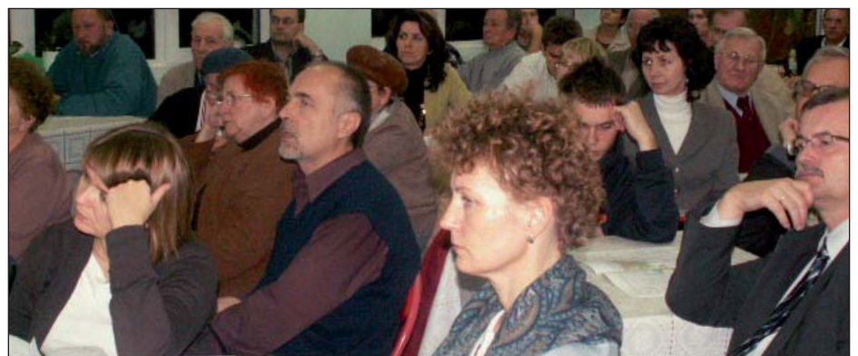
W spotkaniu uczestniczyło wielu mieszkańców

Drodzy Przyjaciele, Znajomi, Sąsiedzi, i moi Pacjenci, dziękuję Wam bardzo za aktywność w dniu 21.10 i pomoc w trakcie kampanii wyborczej. To dzięki Państwu uzyskałam ogromną liczbę głosów (5763). Serdecznie dziękuję za poparcie, ciepło i słowa otuchy, z którymi spotykam się na każdym kroku.