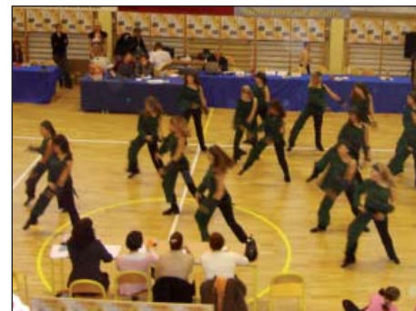
Pokaz tańca nowoczesnego