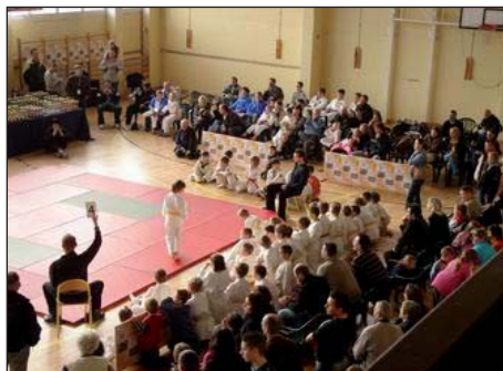
IV Mistrzostwa Karate o puchar Wójta.