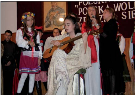
Zwycięski zespół I Konkursu Pieśni Legionowej