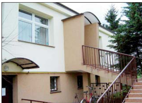
Budynek przedszkola w Nowej Wsi