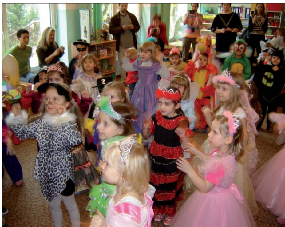
Przedszkolaki podczas balu karnawałowego

Proponujemy bogatą ofertę zajęć dodatkowych takich, jak: rytmika, język angielski, taniec, plastyka, gimnastyka korekcyjna wspierających harmonijny rozwój dziecka, umożliwiających rozwój zainteresowań naszych wychowanków. W ciągu roku szkolnego odbywa się wiele wycieczek,