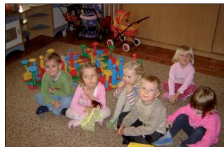
W czasie zabawy