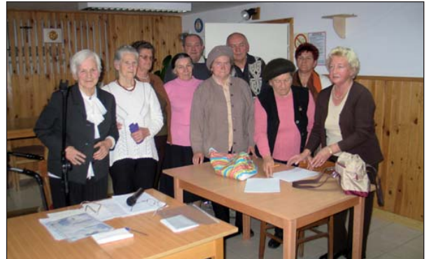
Nowy Zarząd Koła Emerytów w Nowej Wsi

czyn. Przez cały ten okres odbyło się wiele spotkań okolicznościowych, między innymi wigilijne, noworoczne i wielkanocne, a także Dzień Babci i Dziadka, Dzień Kobiet, Walentynki i wiele innych. Członkowie Koła uczestniczyli w licznych wyjazdach jedno i wielodniowych, pielgrzymkach do Częstochowy czy wyprawach na grzyby. Tradycją członków Koła stały się też świąteczne odwiedziny chorych i obdarowywanie ich paczkami. W minionej kadencji sześć osób otrzymało Złote Odznaczenia Związkowe. Byli to: Jadwi-