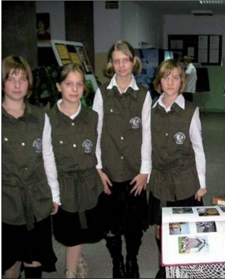
Uczennice szkoły w Nowej Wsi

Ta niezwykle interesująca ekspozycja została przygotowana przez uczniów, należących do Koła Miłośników Historii, działającego przy Gimna-