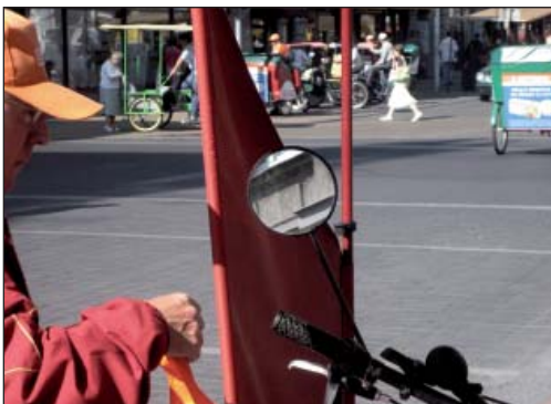
Uczniowie w ramach projektu „Człowiek w przestrzeni miasta” odwiedzili Łódź

Zwolle to miasto, w którym mieszka ponad 100 tysięcy mieszkańców. Uczniowie, którzy przyjechali do Komorowa chodzą do szkoły, która jest odpowiednikiem naszego liceum, mają po 16-18 lat. Wcześniej gościli w swoich domach naszych