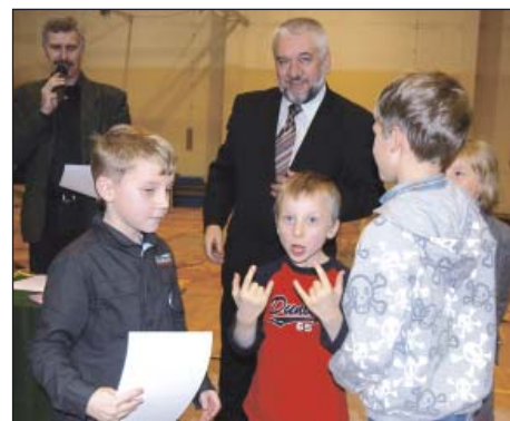
Wręczaniu dyplomów towarzyszyła radość i rozluźnienie