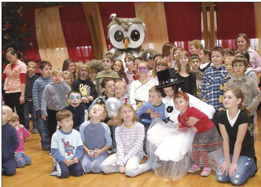
Michałowice – pamiątkowe zdjęcie ze spotkania

Mikołaj spotkał się z najmłodszymi na sali sportowej w Ośrodku Rehabilitacyjnym Olimpijczyków. Zabawa została zorganizowana przez Gminny Ośrodek Pomocy Społecznej dla dzieci z rodzin objętych pomocą ośrodka oraz dzieci niepełnosprawnych. Jak co roku chętnych do zabawy nie brakowało. Najmłodszy mieszkaniec mieli zapewnioną masę atrakcji, najróżniejsze turnieje, kącik plastyczny, malowanie twarzy, gry i zabawy. Nie zabrakło także upominków od Mikołaja.