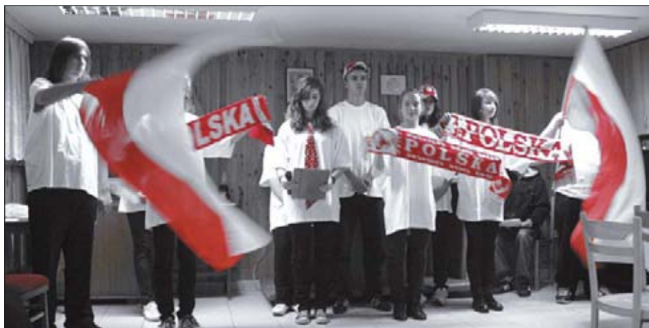
Nowa Wieś – Jeszcze Polska nie zginęła...

Uczniowie klasy IIIa z gimnazjum, przygotowali okolicznościowy program artystyczny. Odśpiewano Hymn Państwowy. Przybliżone zostały najważniejsze wydarzenia z dziejów Polski i przypomniano sylwetki takich wielkich postaci, jak Ksiądz Piotr Skarga, Józef Piłsudski, Ksiądz Jerzy Popiełuszko, Jan Paweł II i wielu innych wspaniałych ludzi, dzięki którym Polska nie zginęła. Ze wzruszeniem oglądano występy uczniów, przypominające bohaterską i ofiarą wal-