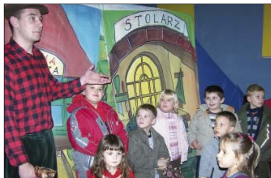
Podziękowania dla dzieci biorących udział w przedstawieniu