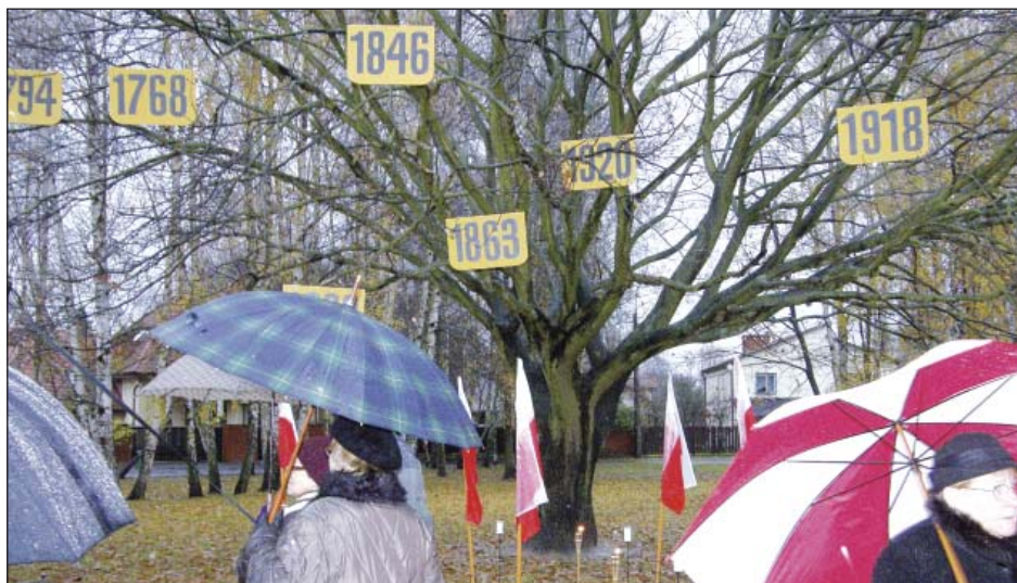
Komorów – na drzewie zawisły tablice z datami upamiętniającymi ważne wydarzenia z historii Polski