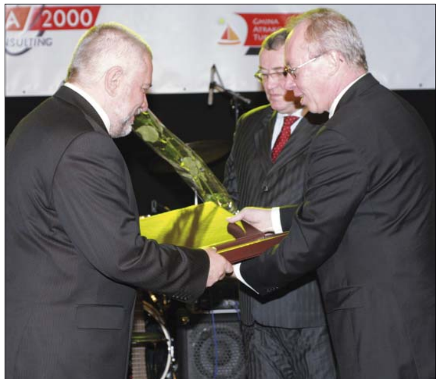
Wojewoda Mazowiecki wręcza dyplom Wójtowi Gminy Michałowice