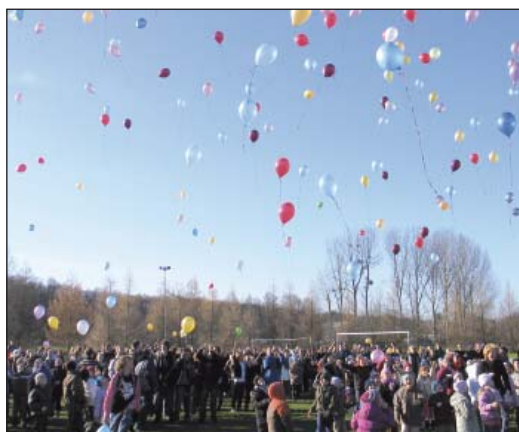
Balony szybią do nieba

Opracowano na podstawie artykułów Jadwigi Jodłowskiej oraz Anny Tyszko