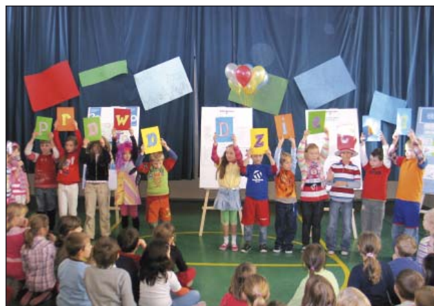
Obchody dnia Praw Dziecka