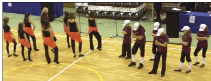
Występy zespołów tanecznych

W dniach 07-08.11.2009, w szkole podstawowej w Michałowicach odbyły się V Michałowickie Spotkania Artystyczne Dzieci i Młodzieży oraz VI Turniej Karate, mający rangę mistrzostw Mazowsza, o Puchar Wójta Gminy Michałowice. Wydarzenie to mogło się odbyć po raz kolejny dzięki znakomitej współpracy władz gminy, dyrekcji Zespołu Szkół oraz klubu WKSZ Zdrowie.