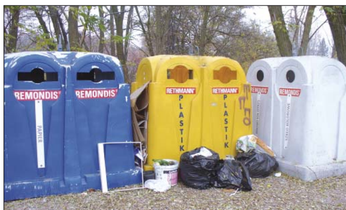
Worki z odpadami są często ustawiane obok pojemników.

Na pewno towarzyszy nam pewien niesmak, gdy przejeżdżamy obok nich. Jednak to od nas