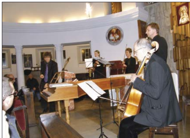
Zespół CONCERTO POLACCO

Opracowano na podstawie artykułów Beaty Izdebskiej