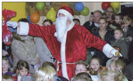
Mikołaj starał się jak mógł, aby wszyscy dostali prezenty