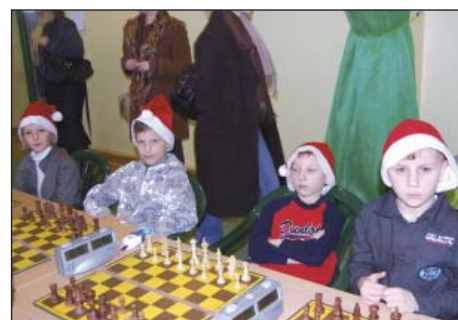
Drużyna Św. Mikołaja