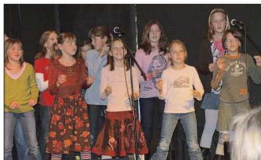
Michałowicki zespół muzyczny