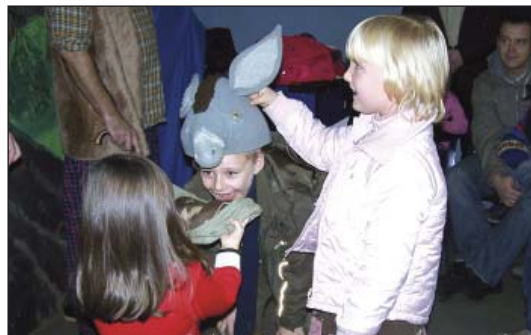
Spektakl „Stoliczku nakryj się” z udziałem dzieci