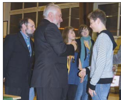
Zdobywcy drugiego miejsca otrzymują gratulacje i medale z rąk Wójta Gminy