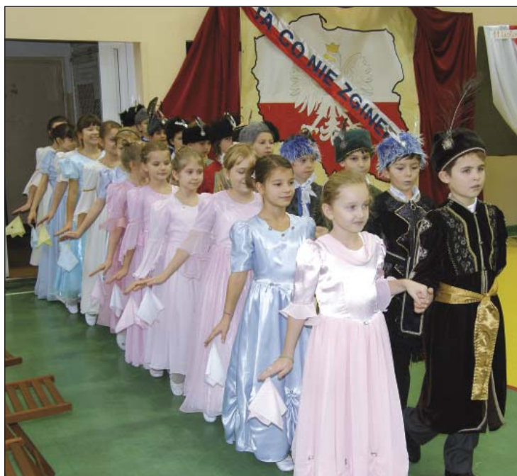
Komorów – uczniowie klas trzecich tańczący poloneza