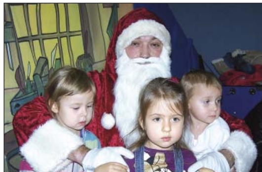
Nadszedł czas na wspólne zdjęcia