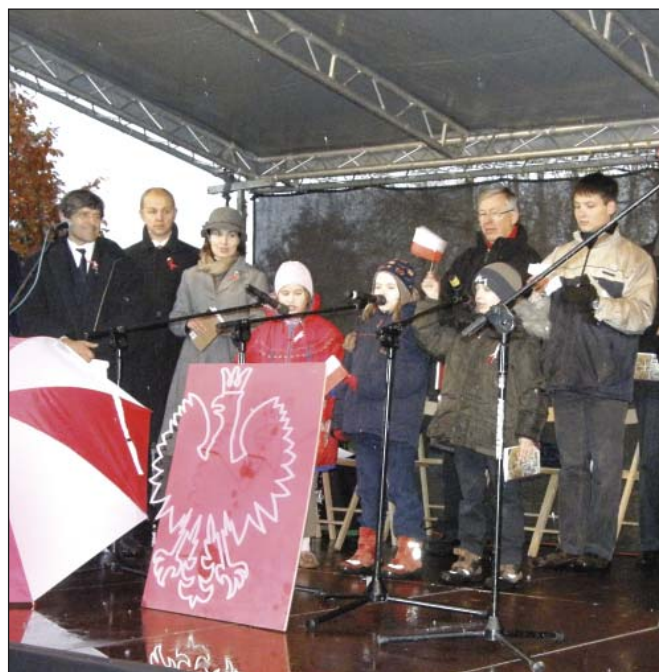
Komorów – spotkanie o nazwie „Ja z tobą, ty ze mną”