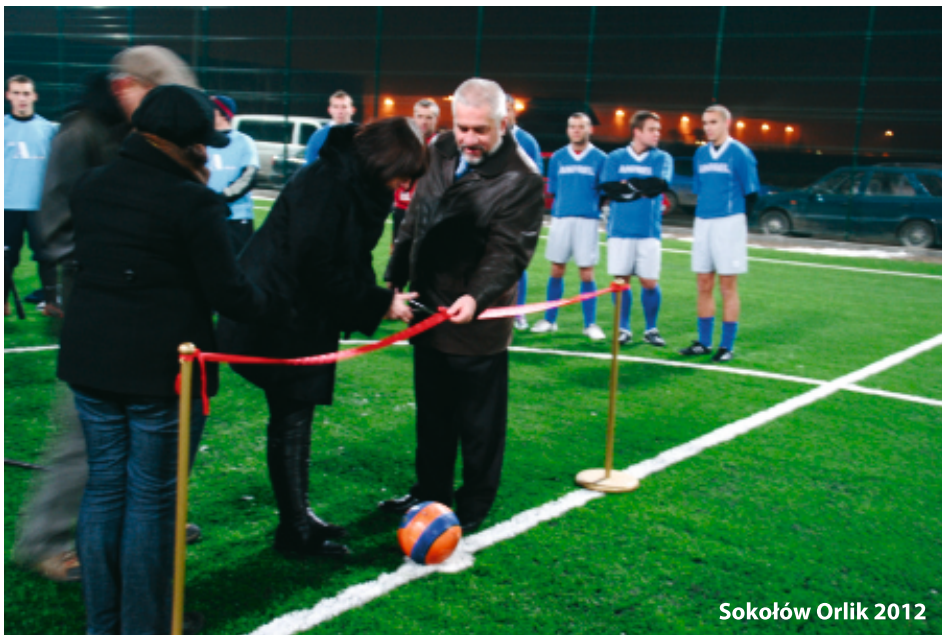
Sokołów Orlik 2012

Boisko zostało wybudowane w Sokołowie, przy ul. Wspólnoty Wiejskiej. Budowa Orlika ruszyła w sierpniu 2010 r. Oficjalne otwarcie nastąpiło 26 listopada. Obiekt składa się z boiska do piłki nożnej – oświetlonego reflektorami, mniejszego do koszykówki (może być boiskiem wielofunkcyjnym), świetlicy o powierzchni ponad 150 m kw., dwóch szatni z natryskami i sanitariatami oraz monitoringu. Finansowanie budowy „orlików” miało nastąpić z 3 źródeł - po 333 tys. mieli przekazać Ministerstwo Sportu i Turystyki oraz Marszałek Województwa Mazowieckiego, pozostałe koszty miały zostać pokryte przez gminę. Marszałek województwa niestety zrezygnował z dotowania w pełnej kwocie „orlików”. W konsekwencji otrzymaliśmy tylko jej część - 100 tys. Wartość całej inwestycji wyniosła 1,7 mln zł.