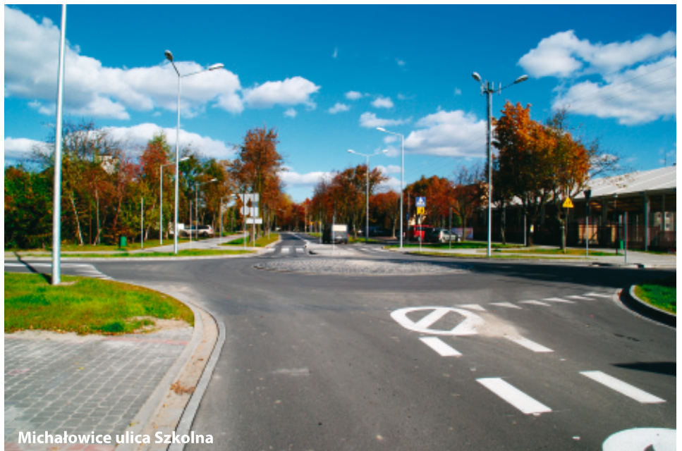
Michałowice ulica Szkolna

Jest to wspólna inwestycja Pruszkowa i gminy Michałowice o wartości 5,5 mln zł. Koszty zostały podzielone proporcjonalnie między miastem i gminą. Gmina poniesie większą ich część.